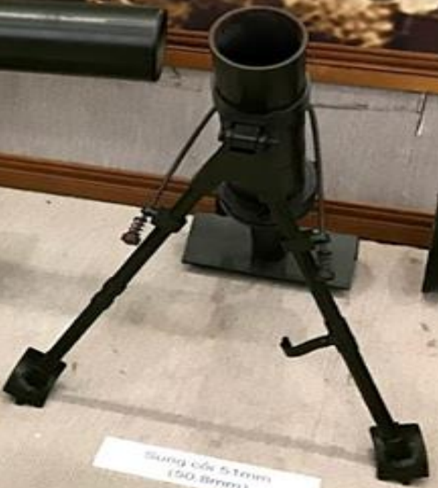
Súng cối 5-Tren (50.8mm)